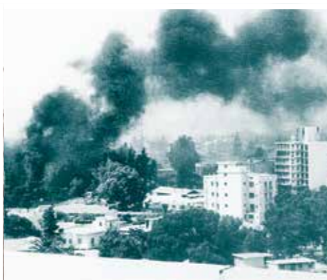
15 Νιόβριος 1967. Επίθεση στην Κοφίνου